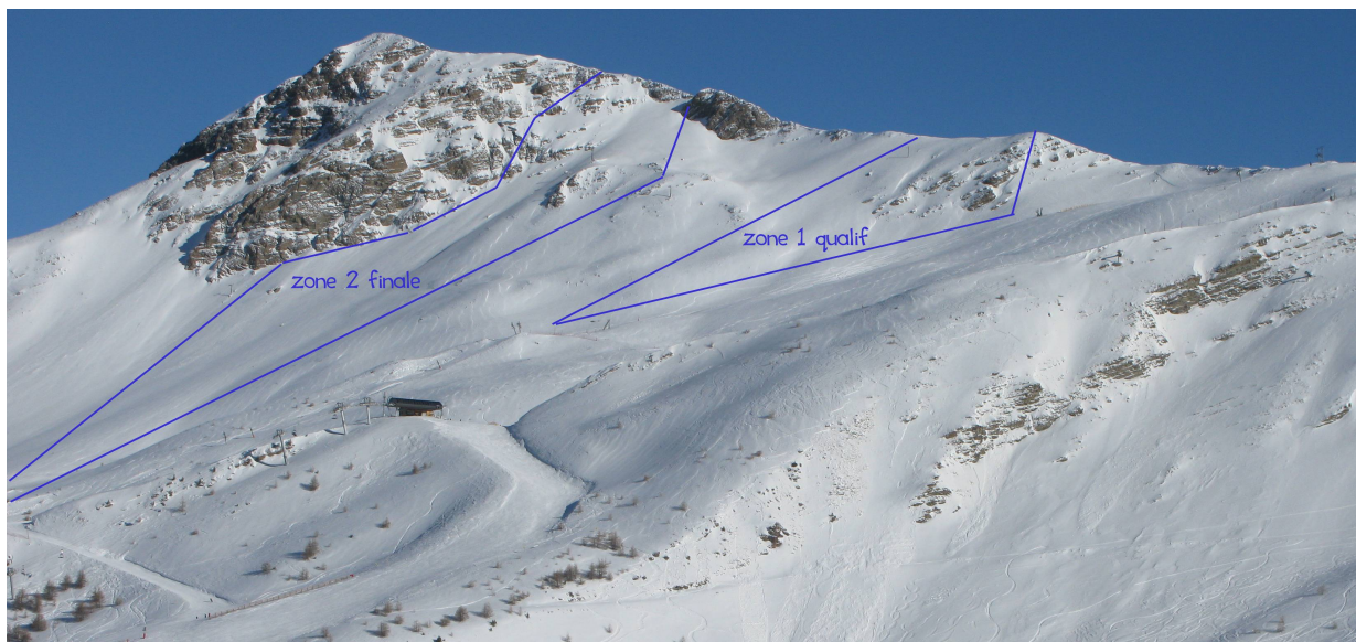
Site du contest freeride, qualif et finale, qui sera confirmé le matin au briefing.

De nombreux lots ( Rossignol, Julbo, Remise sur des sac ABS, Matériel de montagne ...) seront tirés au sort parmi les participants durant la soirée.